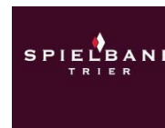
Spielbank Trier 2013, Tisch 1